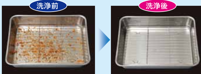
●油きりバットの油汚れをしっかりと落とします。