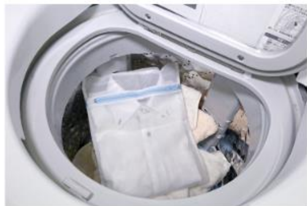
ワイシャツはネットに入れて脱水を短めに