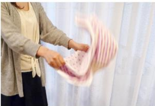
タオルは力強く振りさばいてから干す

タオルをいつまでもふわふわにしておきたい人は、ループを立ち上げるために、洗濯後に力強く振りさばいてから干したり、乾ききる前に乾燥機にかけていました。また、体になじむ着心地を大切にしている男性は、新品の衣類を一度洗濯してから着たり、あえて折り目をなくすようにアイロンをかけていました。ワイシャツのシワは気になるがアイロンのピシッと感は好きではないという男性は、洗濯ネットに入れて脱水を短めに設定して洗濯し、干すときには手でたたいて伸ばしながら太めのハンガーで形よく干していました。