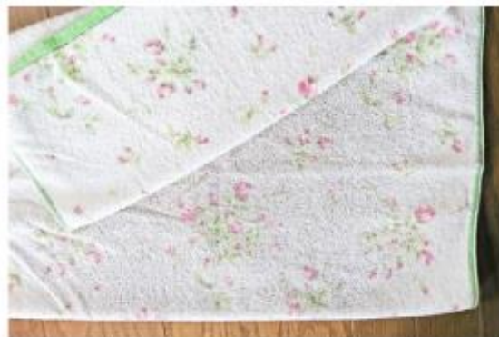
タオルは洗濯していても、だんだん黒ずんできて、かたくなったりニオイがとれなくなったりして、がっかり

特にそれがお気に入りの衣類やタオルの場合は、黒ずみ、ニオイが判断基準になり、「もう着られない」「ニオイがとれないと使いたくない」と、廃棄したり、使用しなくなったりといった行動にまでつながっていました。お気に入りの衣類を長持ちさせたい、心地よく着ていたいと思っているのに、汚れやニオイによって、それがかなわないのはとても残念なことです。