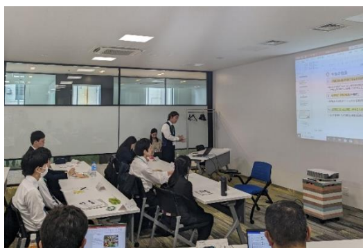
<新入社員半年後報告会>