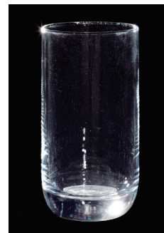
アクシャル ニュースター 液体 NR 洗浄濃度0.15%