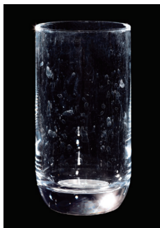
従来品 + リンス剤 洗浄濃度0.15%、リンス剤100ppm