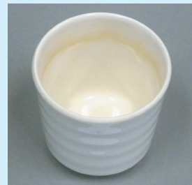
漂白剤配合無し洗浄剤 50回洗浄