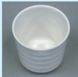
ニュースター NB 50回洗浄