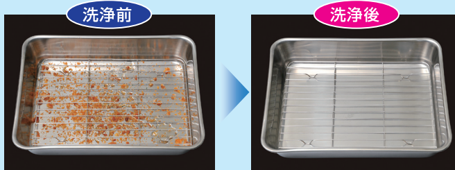
●油きりバットの油汚れをしっかりと落とします。